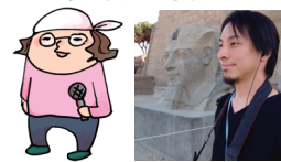
※リモート出演になります。